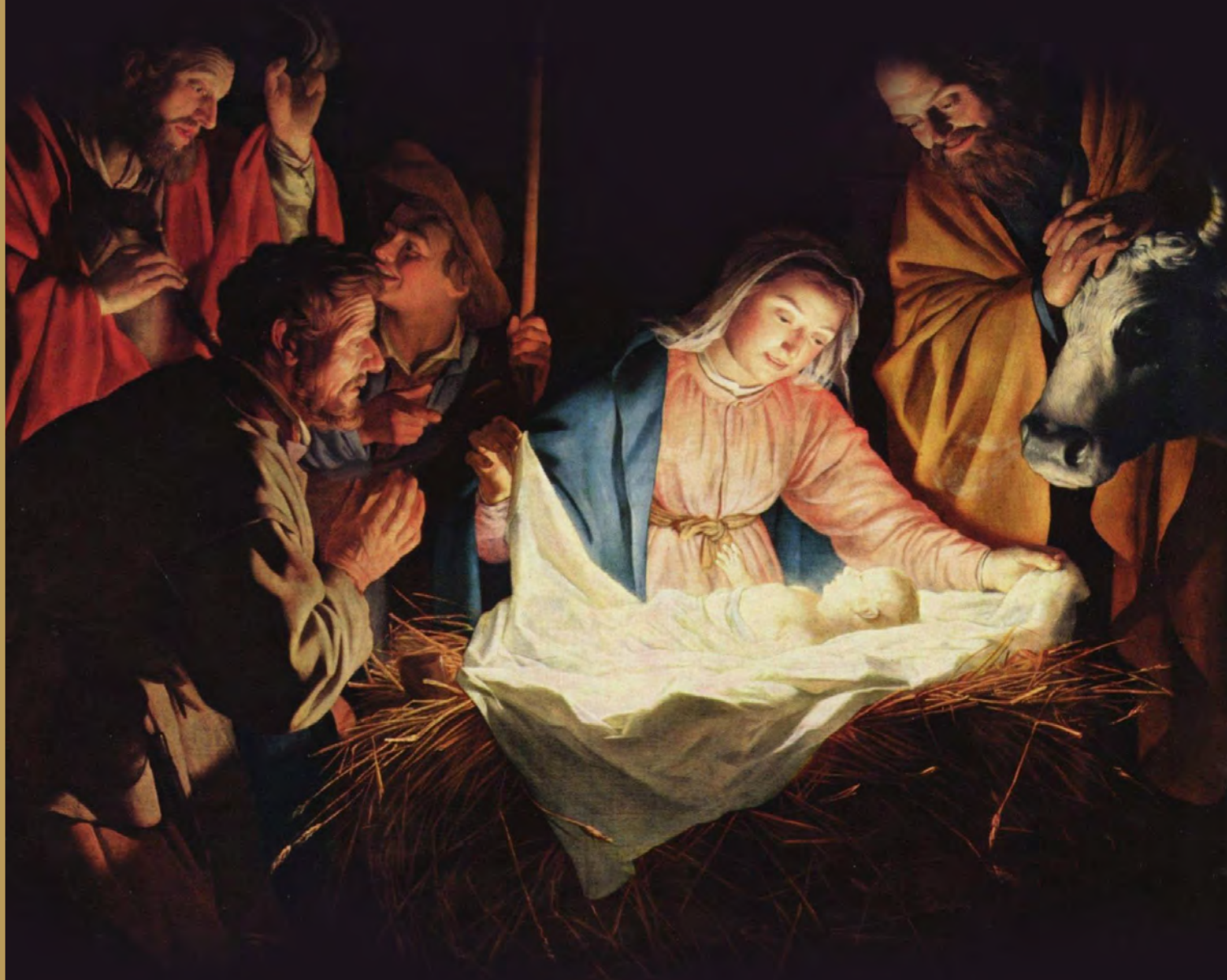
Gerard van Honthorst, Adorazione dei pastori, 1622. Colonia, Wallraf-Richartz Museum.