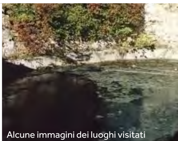
Alcune immagini dei luoghi visitati