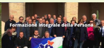
Formazione integrale della Persona