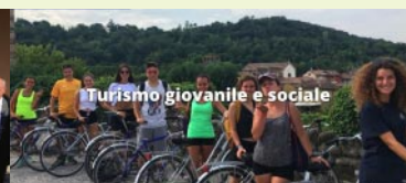
Turismo giovanile e sociale