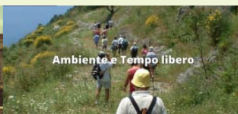
Ambiente e Tempo libero