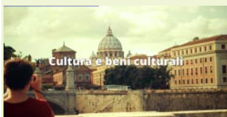
Cultura e beni culturali